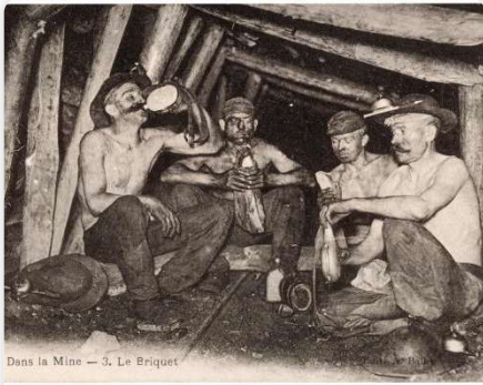
Dans la Mine — 3. Le Briquet